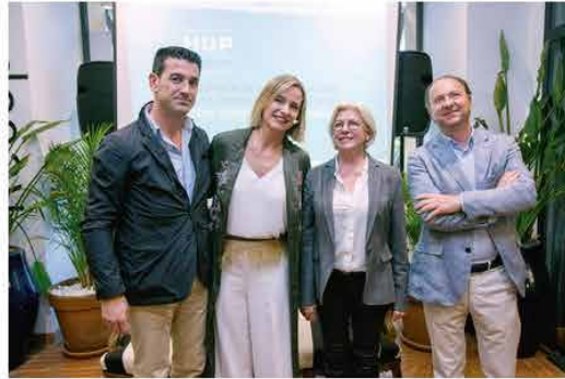
Ganadores del concurso al mejor hotel boutique organizado por HUP y Porcelanosa.

TAGS: BODEGAS VICENTE CANDÍA, HUP INTERIORISMO-DISEÑO, PORCELANOSA