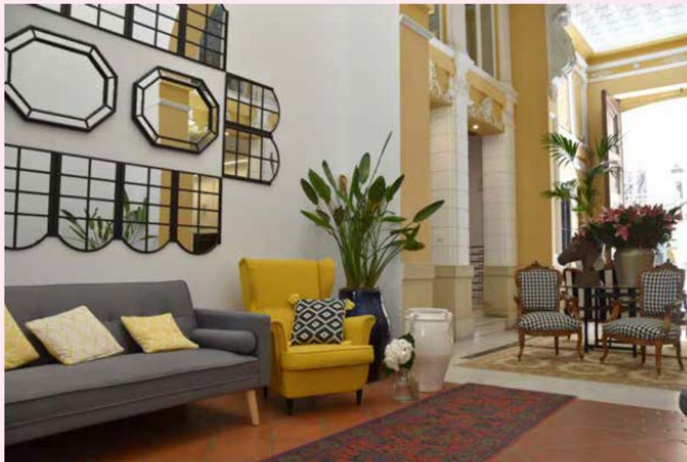
LA ENTRADA SEÑORIAL DEL PALACIO DE ROJAS, EN LA CALLE CABALLEROS DE VALENCIA

Los colores albero y granate de la fachada del Palacio de Rojas inspiraron a HUP Interiorismo+Diseño para darle coherencia a todo el edificio en global y un título al proyecto, que no podía ser otro más que "Nobleza Mediterránea".